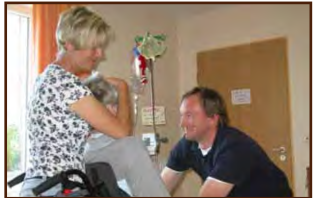
Betreuungsstunde mit Physiotherapie