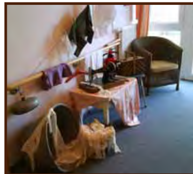
Themenbereich im Pflegezentrum

Sämtliche Teile des Hauses sind für Gehbehinderte und Rollstuhlfahrer bequem zu erreichen.