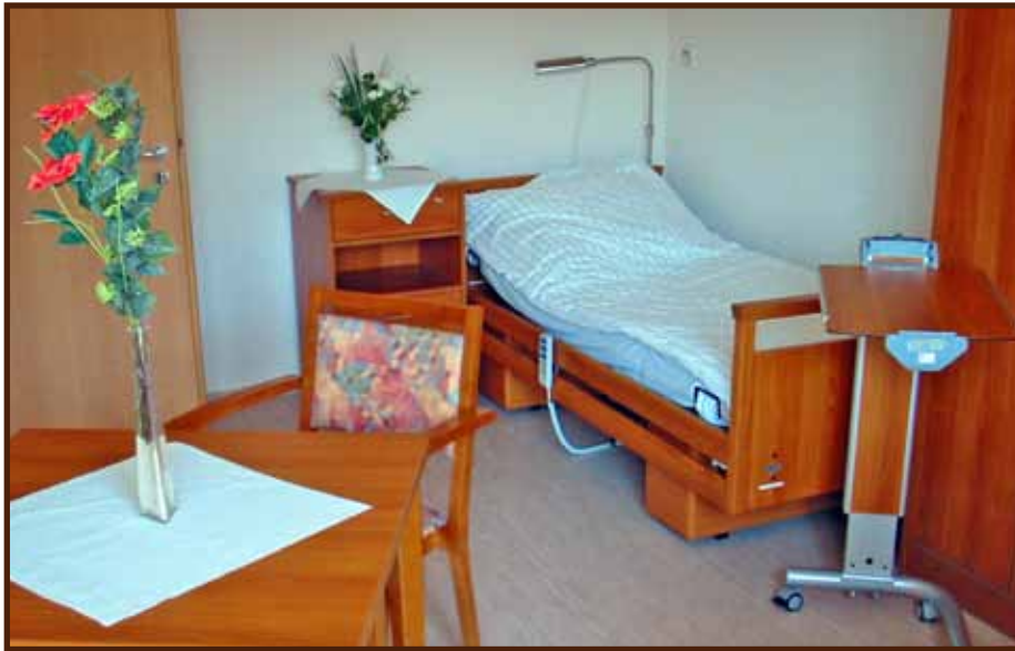
Beispiel eines Doppelzimmers

Unser Haus verfügt über 60 Pflegeplätze .