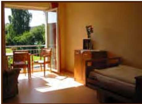
Beispiel eines Einzelzimmers