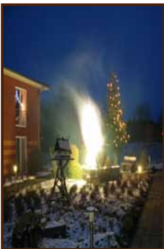
Silvester im Innenhof

Der mediterran geprägte Innenhof dient ebenfalls als Aufenthaltsbereich für Bewohner und Gäste. Hier steht z.B. um die Weihnachtszeit die große geschmückte Tanne.