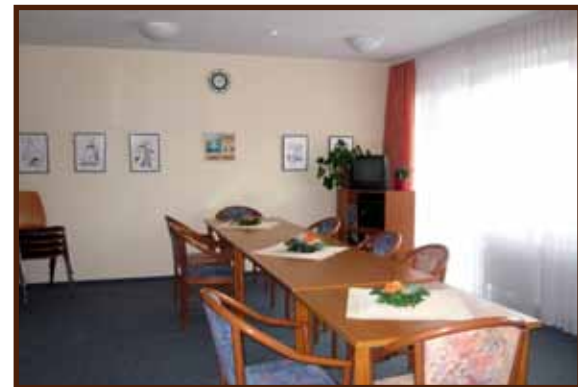
Multifunktionsraum im Obergeschoß