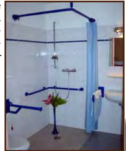
Badezimmer mit Dusche und WC

Im Erdgeschoß haben alle Zimmer eine kleine Terrasse die zum verweilen einlädt. Die Zimmer im Obergeschoß sind mit französischen Balkonen ausgestattet. Wir bieten jedem Bewohner die Möglichkeit einer ergänzenden, individuellen Möblierung. Radio-, Fernseh- und Telefonanschlüsse sind vorhanden.