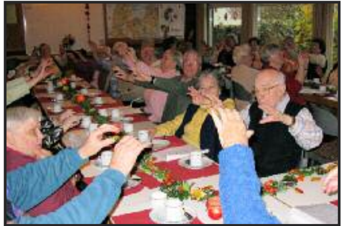
es herrscht eine Bombenstimmung...