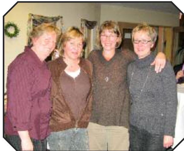
Das starke Frauenteam