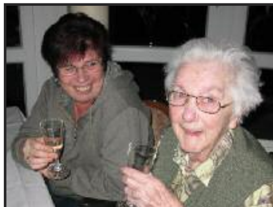
Frau Eilers und Tochter