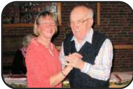
und getanzt wird auch :-)