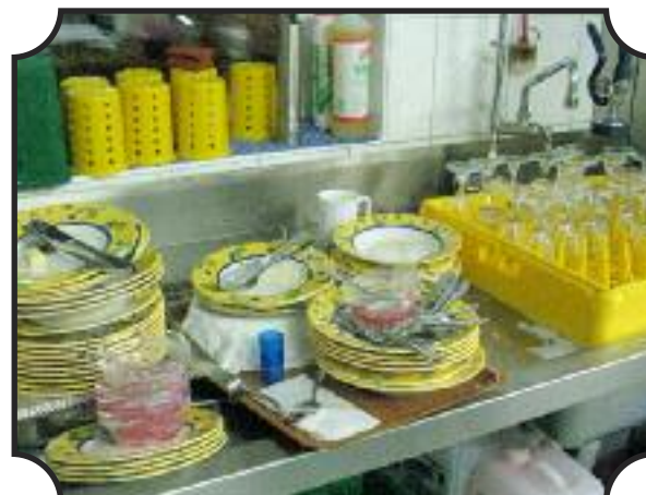
Das Chaos danach