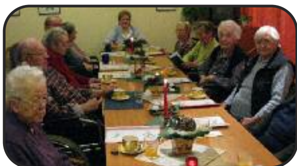
Betreuung im eigenen Haus