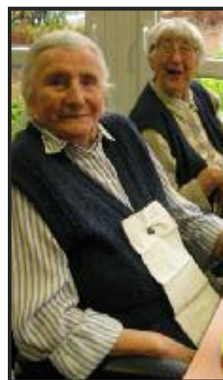
Frau Kreuz und Frau Meiners