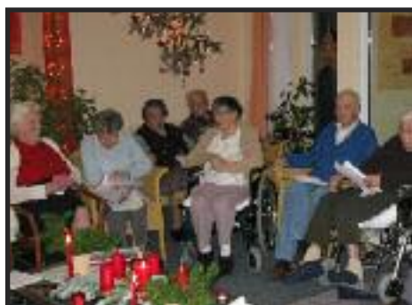
gemütliches Singen in der Eingangshalle