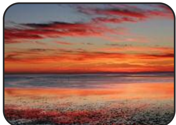
Sonnenuntergang an der Nordsee