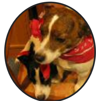
...und seine Rentiere