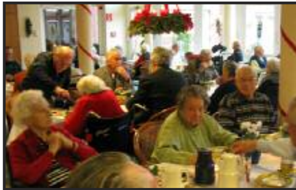
gemütliches Kaffee trinken...