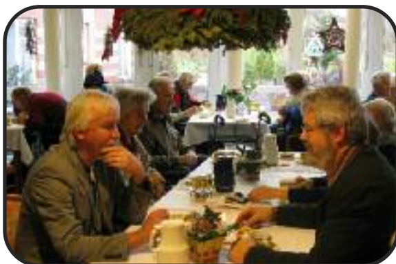
Die Chefs beim klönen....