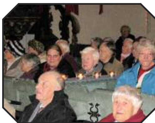
Adventsingen in der Kirche