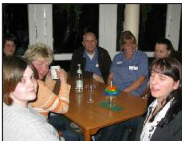
der wohl vielen noch lange in Erinnerung bleibt