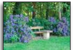
nah gelegenes Wäldchen